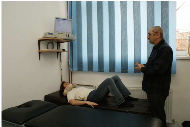
Fig 2. Modul de aplicare al vibrațiilor pe coloană C7 – T12

În urma celor 10 zile de tratament pe componenta DURERE am obținut următoarele rezultate: